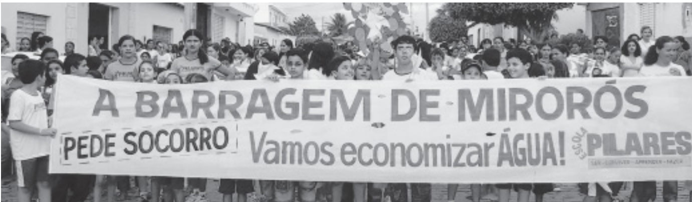
Engagiert: Die Schüler der Escola Pilares fordern zum sparsamen Umgang mit dem Rohstoff Wasser auf. Die Region gilt als besonders trocken und ist gerade von einer außergewöhnlichen Trockenphase getroffen.

■ Herford. Der Stammtisch der CDU Nordstadt fällt aus. Die Ortsunion trifft sich stattdessen beim Besuch der Bundesfamilienministerin Dr. Ursula von der Leyen. Die Ministerin kommt am Donnerstag, 30. Juli, um 19.30 Uhr in den Schützenhof.