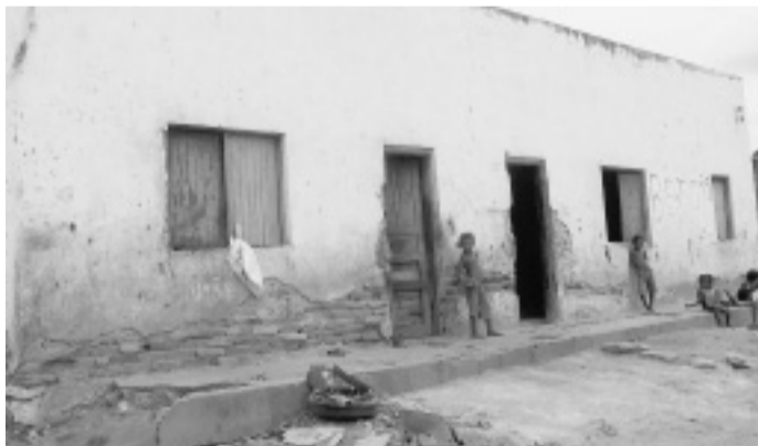
Bretter statt Fenster: Für die Brasilianer ist Bildung der einzige Weg aus den „Favela“ genannten Armenvierteln.